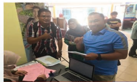
Pendaftaran Pelajar Baharu Program Pascasiswazah