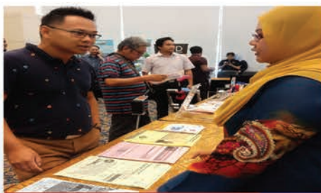
Jerayawara sempena Program Industry Engagement & Networking