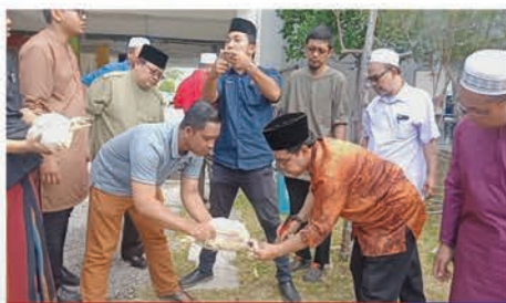
Aktiviti pelajar Diploma Eksekutif Imam Profesional