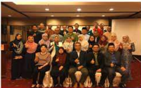
Bengkel Pembangunan Program Eksekutif dan Profesional