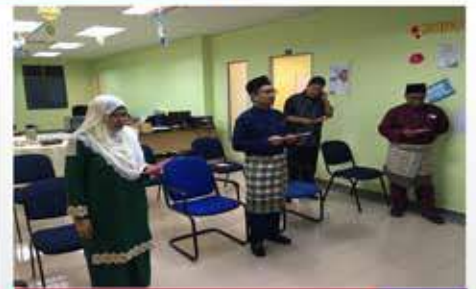
Jamuan Sempena Meraikan Aidilfitri 1441H