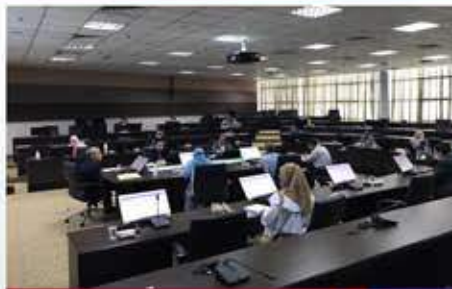
Mesyuarat JKPL Bil. 2/2020